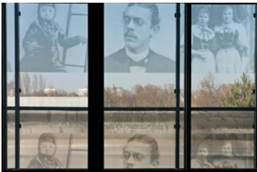
Façade nord sérigraphiée des Archives départementales du Bas-Rhin, vue depuis la salle de lecture.